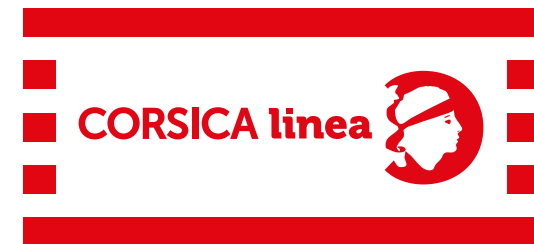
Sur fond troublé