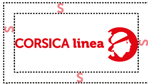
Espace de respiration